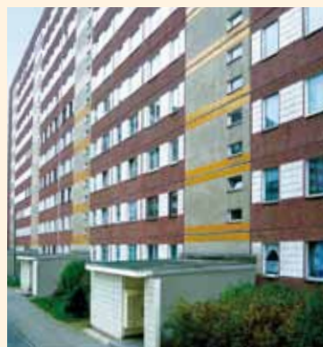
Gute Bausubstanz zeichnet die 1984 errichteten Häuser aus.

Die drei von Monarchis erworbenen elfgeschossigen Gebäude mit 427 Wohneinheiten liegen im sehr attraktiven Stadtteil Lausen-Grünau im Südwesten Leipzigs mit rund 50.000 Bewohnern; gleich beim Naherholungsgebiet Kulkwitzer See. Dieser, als „Stadt in der Stadt“ bezeichnete Bereich verfügt über eine vorbildliche Infrastruktur. Straßen- und S-Bahnen erschließen das Zentrum Leipzigs, und gute Busverbindungen zum Umland machen sehr flexibel. Auch das Straßennetz mit nahe gelegendem Zugang zur Bundesautobahn A 9 ist optimal. Grünau selbst bietet alles, was für den täglichen Bedarf erforderlich ist, vom Einzelhandel über Ärzte und Freizeiteinrichtungen bis hin zu Kirchen aller Konfessionen und verschiedenen Aus- und Fortbildungseinrichtungen.