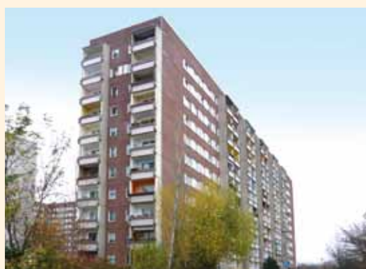
Fast alle Wohnungen verfügen über einen Balkon.