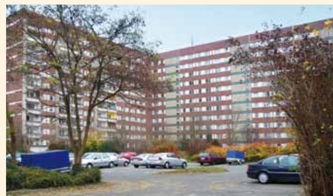
Großzügiger Parkraum und begrünte Umgebung.