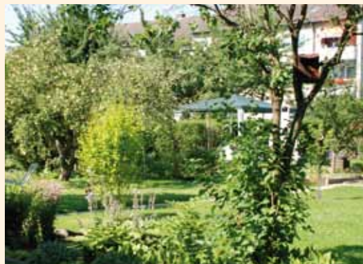
Großzügige Grün- und Gartenflächen steigern die Wohnqualität.