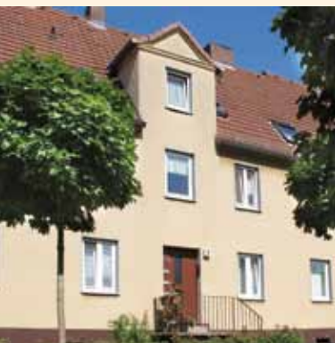
Die Mehrfamilien-Reihenhäuser sind liebevoll gestaltet.

Im Herzen der Gemeinde Lohfelden liegt die Söhrestraße. Die 17 von Monarchis erworbenen Häuser liegen in einer ruhigen Wohngegend mit großzügigen Grünflächen. Dennoch sind es nur wenige Schritte zur belebten Hauptstraße. Wie auf einer Perlenkette aufgereiht sind dort Supermärkte, Bäcker, Metzger, Frisöre und Ärzte angesiedelt. Kindergarten, Schule und Kirche sind auch in unmittelbarer Nähe. Die Objekte liegen in einer der besten und schönsten Lagen in Lohfelden. Sowohl vor, als auch hinter den sehr schönen Gebäuden befinden sich gepflegte, zum teil sehr großzügige Grün- und Gartenanlagen.