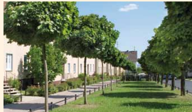
Die Vorderseiten sind alleinartig angelegt.