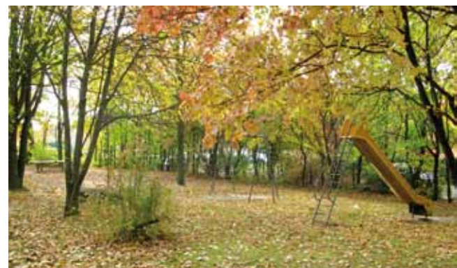
Um die Wohnanlage herum gibt es viele Grünflächen mit reichlich Baumbestand und einen eigenen Kinderspielplatz.