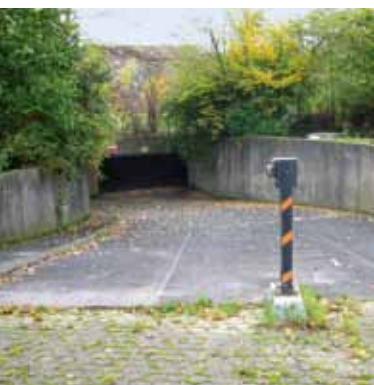
Eine Tiefgarage und ausreichend PKW-Stellplätze sind vorhanden.

Die Monarchis-Wohnanlage „Im Blauen Garn“ im Ortsteil Keldernich der Stadt Wesseling liegt in einem reinen Wohngebiet. Alle Versorgungseinrichtungen wie Einzelhandelsgeschäfte, Kindergärten und Schulen sind leicht erreichbar. Der Öffentliche Personennahverkehr ist gut ausgebaut. Der Ort gehört zum Tarifverbund Rhein-Sieg (TRS), mit dem sich Bonn und Köln gleichermaßen erschließen. Nur wenige hundert Meter von der Monarchis-Wohnanlage entfernt liegt das Naherholungs- und Naturschutzgebiet Entenfang. Mit 75.000 Quadratmetern Fläche ist der Entenfang das Herzstück der Freizeit- und Erholungsangebote der Stadt Wesseling. Hier kann man grillen, spielen, wandern, feiern, sich sonnen oder ganz einfach entspannen und nichts tun.