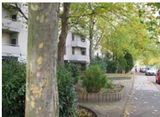
Alter, gesunder Baumbestand und gepflegte Rabatten schmücken den Eingangsbereich der Häuser.